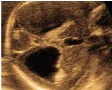
Opouzdřený subarachnoidální hematom + sekundární obstrukční hydrocephalus